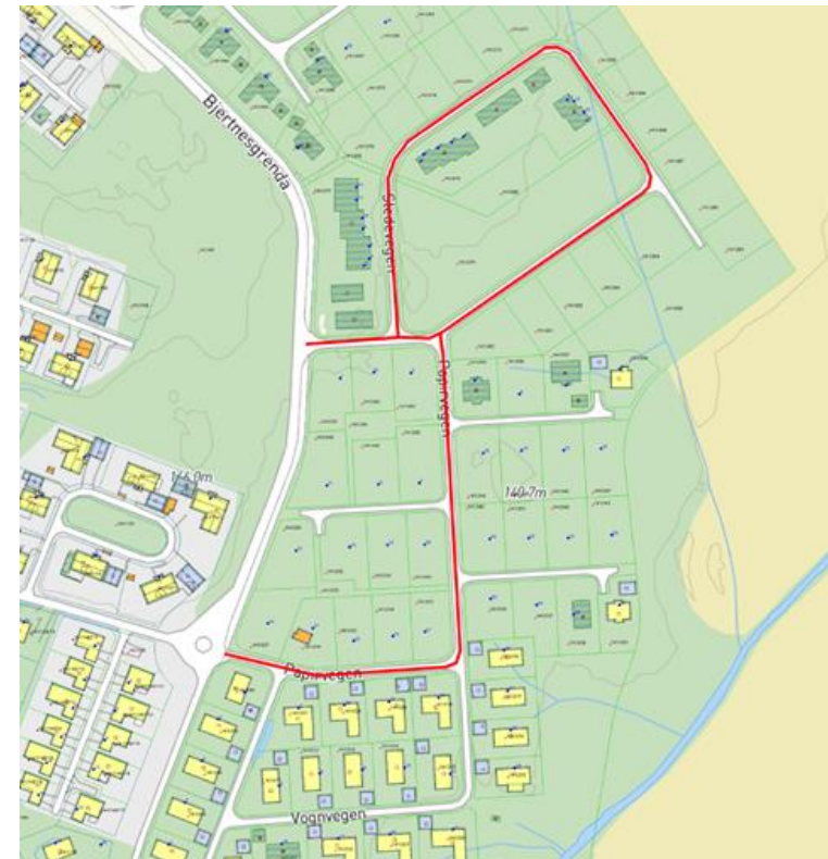
Kommunen har en avtale om å overta offentlig veg eiendom innenfor B3