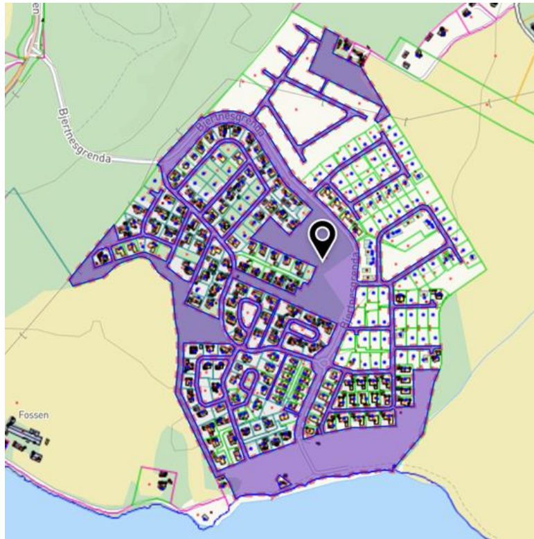
Bjertnestunet utvikling AS eier 141/9.