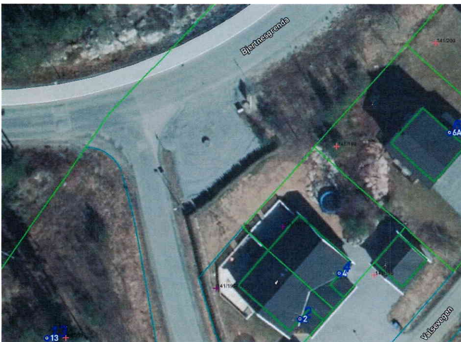
Bilde 4: Flybildet viser gruset plass hvor elever kan vente på bussen. Bussen stopper i dag på nordsiden av veien Bjertnesgrenda.

Skolebussen stopper ved krysset Bjertnesgrenda/Sliperisvingen. Skolebussen kjører til enden av Bjertnesgrenda, snur og kjører tilbake. Skolebussen stopper på andre siden av veien i forhold til boligene, slik at elevene må krysse veien før de går på bussen.