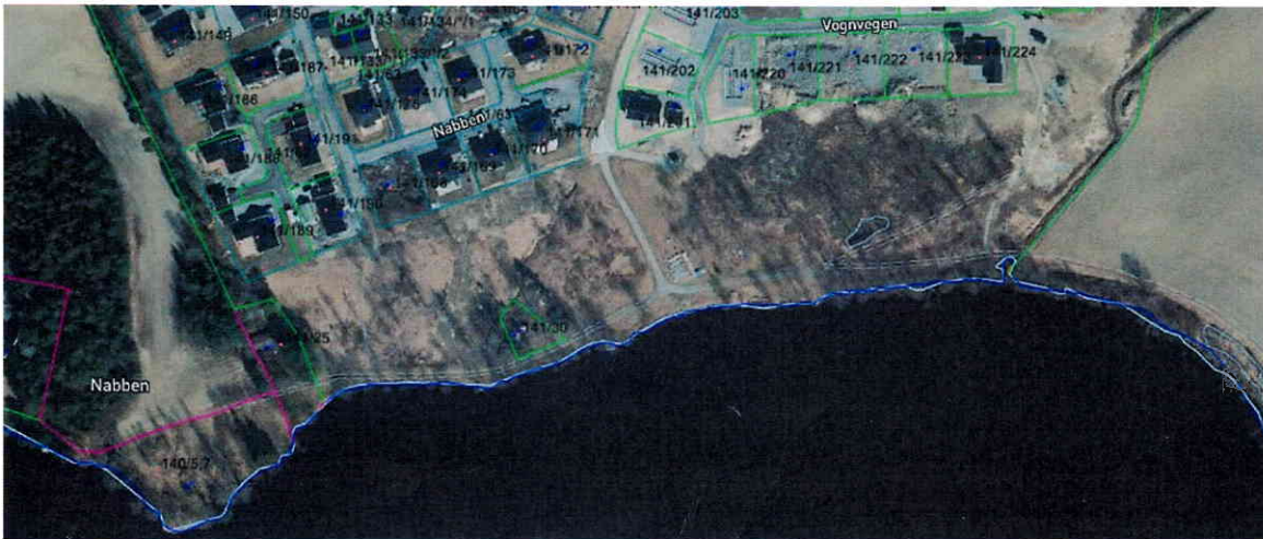
Bilde3: ortofoto fra området mellom bebyggelsen og elva. Turstien går langs elva og er et fint rekreasjonsområde for flere enn feltets beboere.

Velforeningen har derimot ønske om å gjennomføre skjøtsel på deler av området, de vurderer også å sette opp gjerde mot elva. Velforeningen ønsker imidlertid ikke å gjøre dette så lenge arealene har en annen eier.