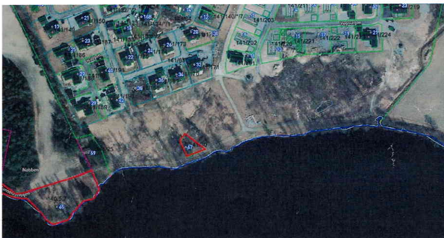
Bilde 2: Utsnitt av ortofoto. Kommunens eiendommer er merket med rød linje.

De store grøntområdene, friområdene, eies i dag av Bjertnestunet utvikling AS, med unntak av eiendommene 141/30 Nubbestua og 140/7 Funnefossvegen 65, som eies av kommunen. Begge eiendommene beliggende ned mot Glomma langs Funnefossvegen/turstien.